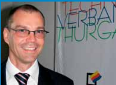
Gebäudetechniker setzen auf den Nachwuchs 100. Hauptversammlung in Steckborn Seite 19