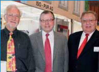
Leistungsschau des AachThurLandes übertraf Erwartungen 93 Aussteller und ca. 8000 Besucher Seite 13