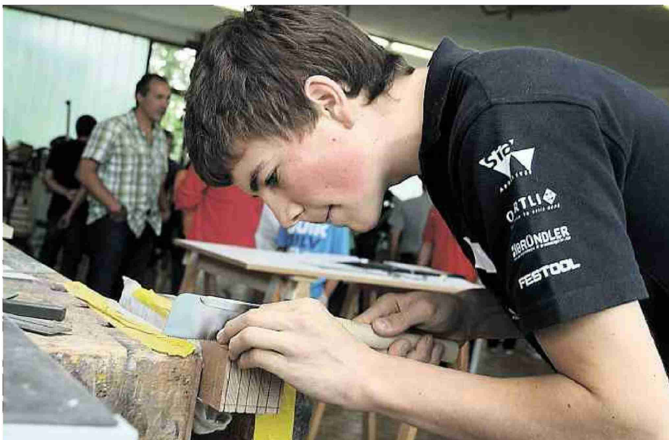
Publikumsmagnet «Power-Schreinem»: Selbst ausgewiesene Fachleute staunten nicht schlecht, wie schnell die Aufgaben gelöst wurden.