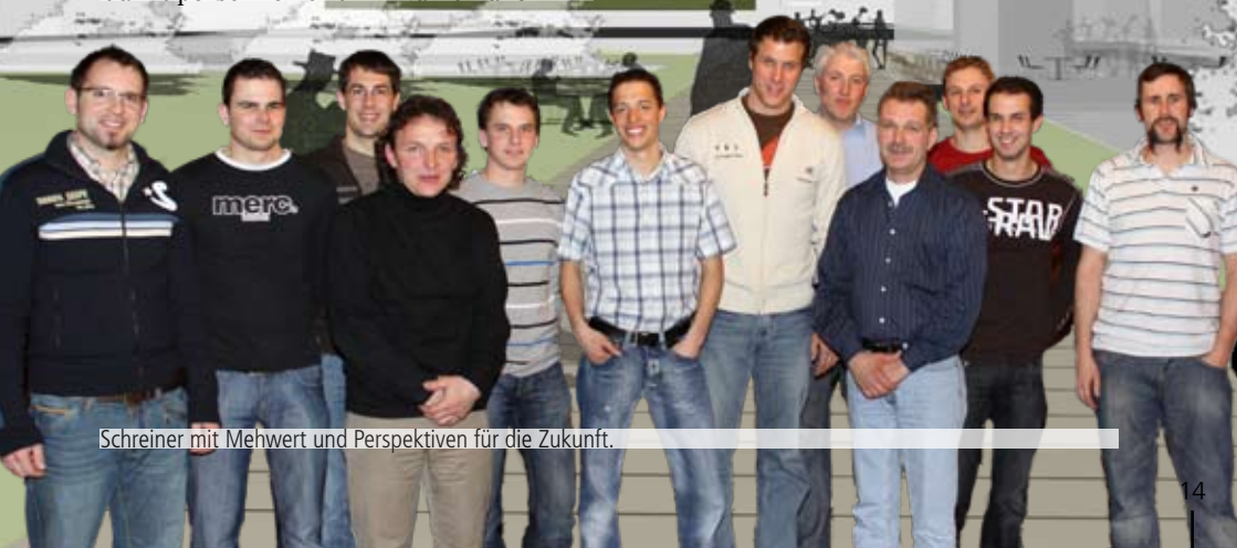
Schreiner mit Mehrwert und Perspektiven für die Zukunft.

In seiner Rede unterlässt er es nicht, jenen zu danken, die es ermöglichen in der Region eine Weiterbildung für die Schreiner anzubieten. Damit gibt man der Branche eine Chance sich vor Ort voranzubringen und zu entwickeln. Um den Horizont zu erweitern und den Austausch zu