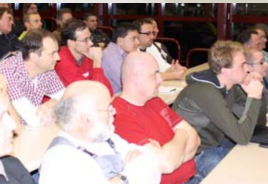
Mitglieder und Nichtmitglieder hören aufmerksam zu.

Freundliches Auftreten, korrekte Kleidung, richtiges Benehmen und fachmännische Beratung - nach ihnen wird der