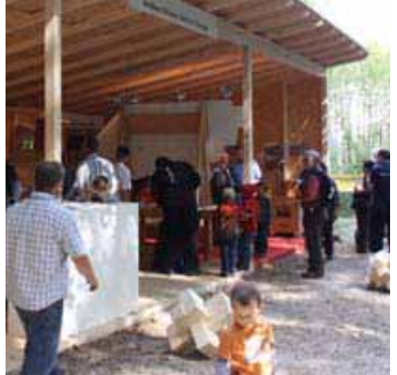
Ausstellungsstand der ProHolz Thurgau (Verband Schreiner Thurgau VSSM) an den Waldtagen 2009