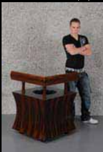
Egger Kevin Ledermann Brünger AG