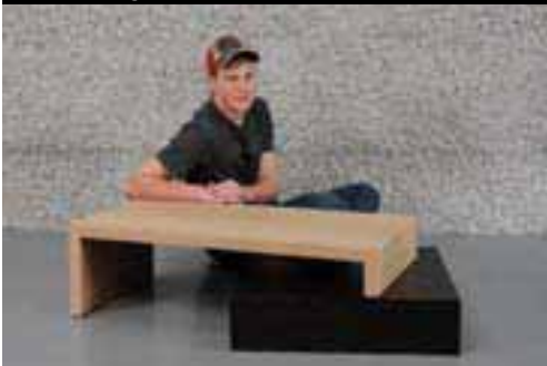
Koller Philipp Warger Schreinerei