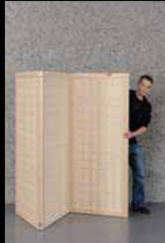
Frey Lukas Max Aeschbacher AG