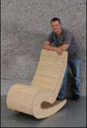
Rickli Friedrich Roost AG