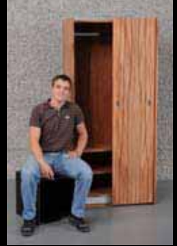
Pfister Hanspeter Herzog Küchen AG