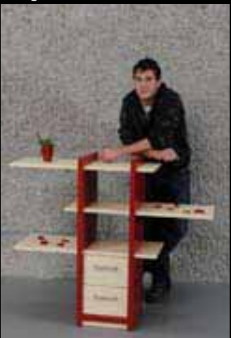
Brüllhardt Reto Stutz Schreinerei AG