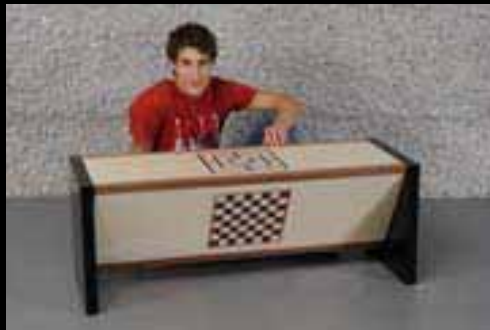
Wagner Robin Magnus Moser AG