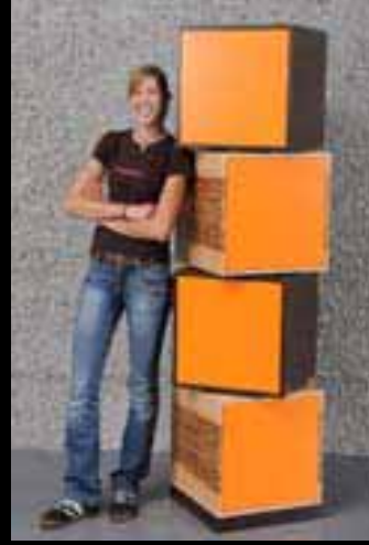
Leutenegger Katja Herzog Küchen AG