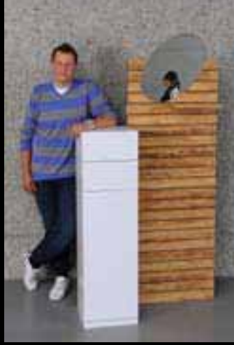
Dervic Almir Schreinerei Bisag AG