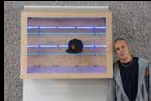
Kreis Roman | CM Chrüzlinge AG