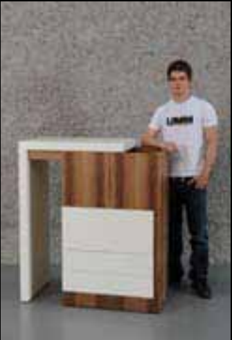
Muff Dimitri Engeler+Frei Schreinerei GmbH