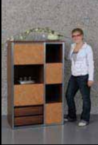
Rütsche Franziska Meienberger+Egger AG