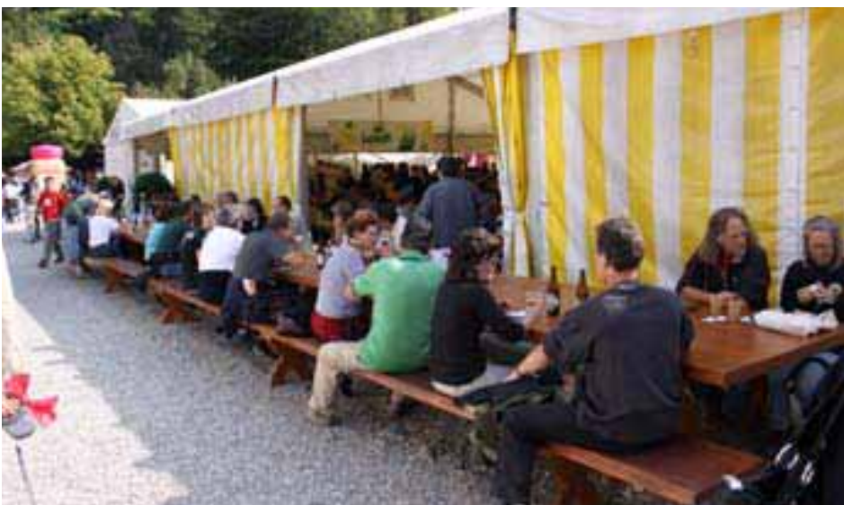
An den Waldtagen in Frauenfeld steht der 12.7 m lange Schreiner-Tisch vom 100-jährigen Verbandsjubiläum 2007 des Verband Schreiner Thurgau VSSM zum Verkauf.