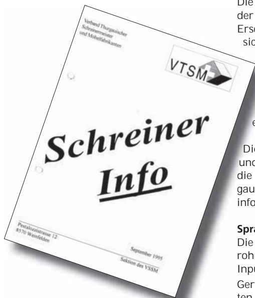
1. Ausgabe Schreiner Info aus dem Jahr 1995

Als Protokollführer des Verband Schreiner Thurgau VSSM ist es mir eine Ehre, ihnen mitzuteilen, dass ich in Zukunft ihre SchreinerInfo produzieren darf.